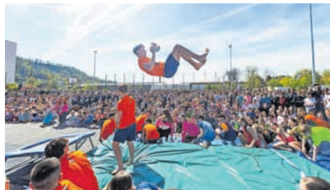
Učenci obeh šol so odprtje pospremili z zanimivo prireditvijo.