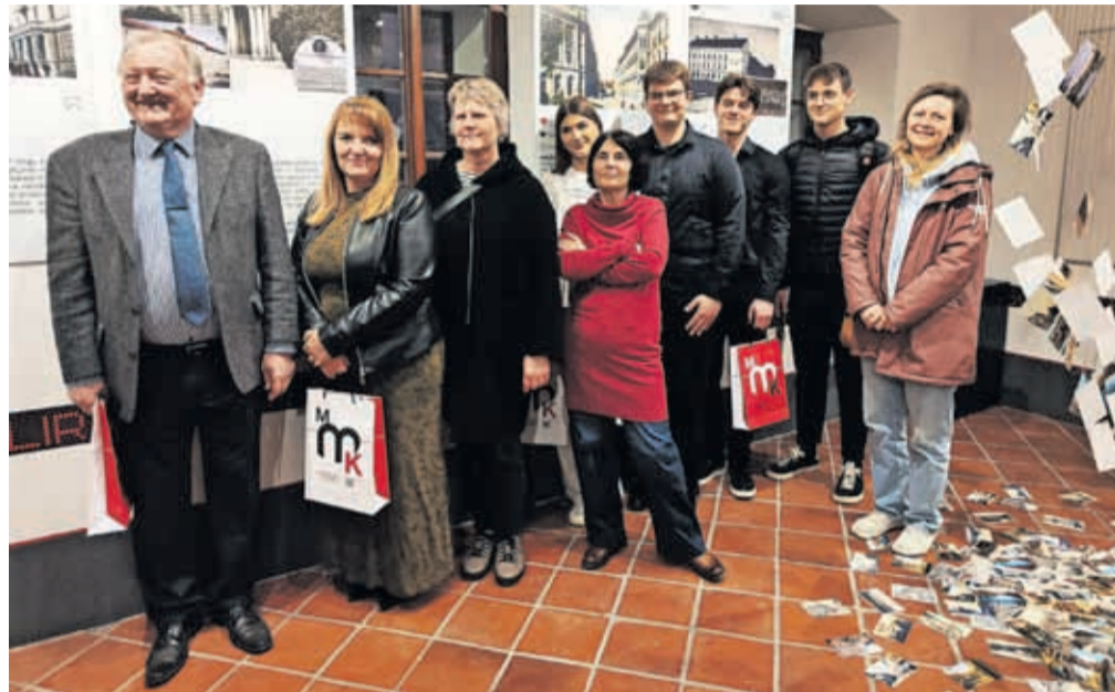
Upravičeno zadovoljstvo celjsko-kamniške ekipe ob snovanju, postavitvi in odprtju nove razstave o Rudolfu Maistru