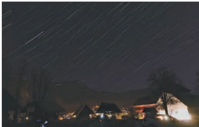
Manca Pristavec je v objektiv ujela sledi zvezd nad Zapricami, ki so posledica vrtenja Zemlje.

telesa ogledajo skozi teleskop. Tik po zahodu Sonca so lahko najprej opazovali Venero, med obiskovalci pa pa sta navdušenje vzbudila tudi Jupiter s štirimi lunami, ki so vidne skozi amaterske teleskope, ter pogled na Lunine kraterje. Tistim, ki jih je zanimal pogled »globlje« v nebo, pa so kamniški astronomi ustregli tudi z nekaterimi meglicami, zvezdnimi kopicami in galaksijami, ki jih ponuja večerno nebo v tem letnem času.