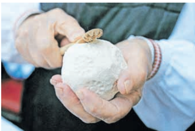
Posebnost trniča so vzorci, odtisnjeni s posebnimi izrezljivimi paličicami, ki jim pastirji rečejo pisave.

29. aprila, ob 17. uri v Samostanu Mekinje. »Udeleženci bodo spoznali zgodovino in etnološki pomen trniča, postopek njegove izdelave ter možnosti vključevanja v turistično ponudbo. Število mest je omejeno, prijave potekajo prek spletnega obrazca. Z vse-