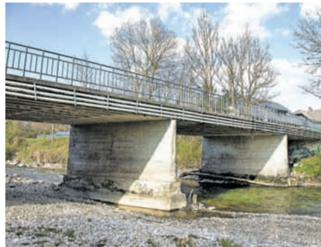
Namesto poškodovanega mosta, ki je zaprt za promet, bodo zgradili novega.

Do zamud je prihajalo zaradi težav s pridobivanjem zemljišč. Kot so nam pojasnili na Direkciji RS za vode, so pred časom podali predlog za uvedbo postopka razlastitve, s čimer bi pridobili še zadnje manjkajoče zemljišče in bi se dela v etapi 1, ki