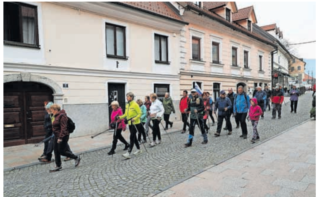
Društvo general Maister Kamnik je pripravilo 21. Maistrov pohod.

Društvo general Maister Kamnik je ob zaključku dogodkov ob občinskem prazniku organiziralo tradicionalni, 21. Maistrov pohod.