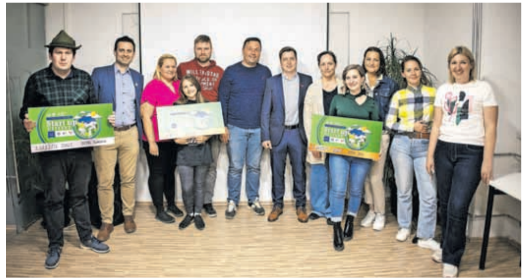
V nedeljo se je zaključil 6. Vseslovenski turistični start-up vikend v Kikštarterju.