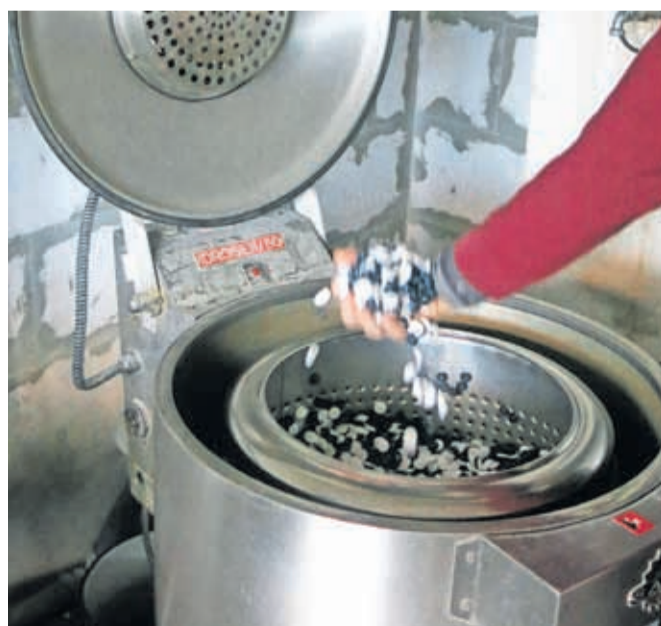
Poliranje gumbov v obratu na Žebljarski ulici