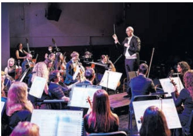
Repertoar Simfoničnega orkestra Domžale - Kamnik je tokrat popeljal v nove svetove.