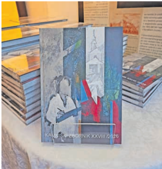
Kamniški zbornik XXVIII/2026