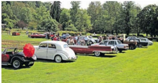
Starodobniki bodo kmalu na ogled v Arboretumu.