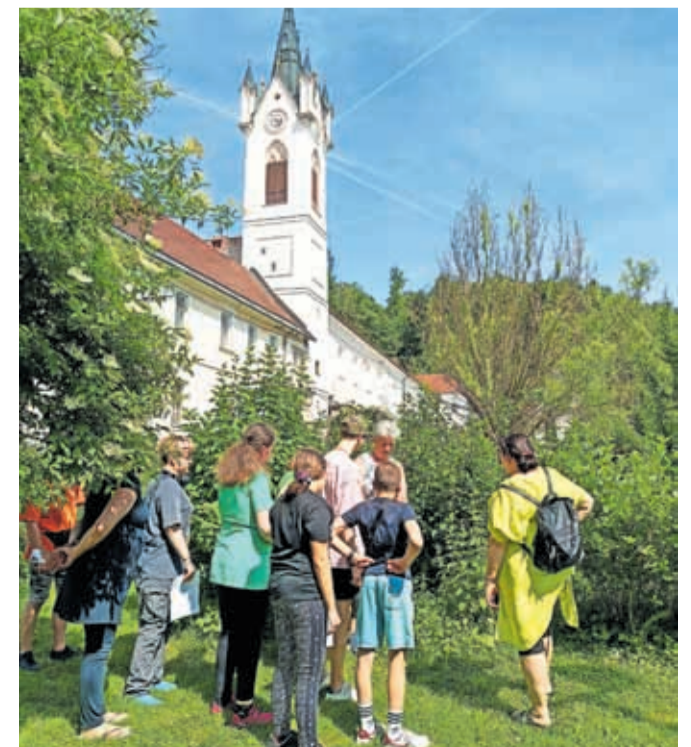
Zeliščni vikend bo potekal med 24. in 26. aprilom.

V današnjem hitrem tempu življenja je takšen zeliščni vikend še posebno dragocen, saj ponuja umik v mirno okolje ter priložnost za pridobivanje znanj za bolj zdrav in uravnotežen življenjski slog.