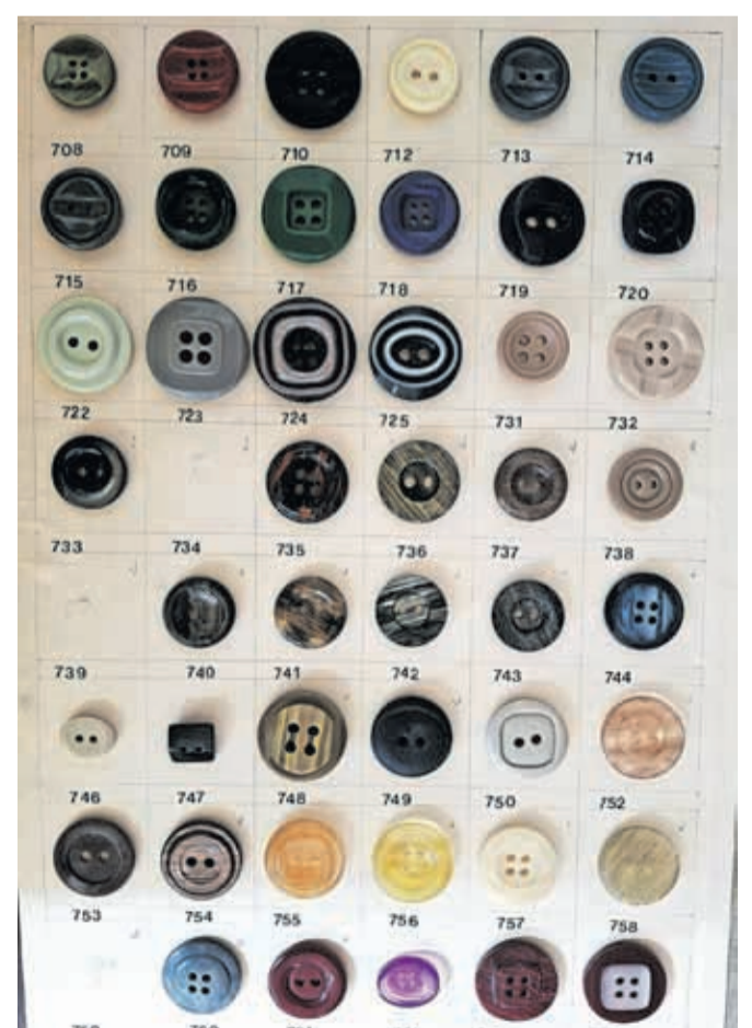
Izbor modnih gumbov iz Kamnika, sedemdeseta leta 20. stoletja

Kakšna pa je tu morala, le posluš vsi tam in tu: dobre gumbice le bo dala tovarna gumbov v Kamniku. Podjetje, ki je postalo znano pod imenom Modelit, je v začetku šestdesetih let predstavljalo pomemben del kamniške industrije. Zasedili smo podatek, da so leta 1962 izdelali 202.200 grosov gumbov. Gros šteje 144 kosov. Nekoč je bila to praktična trgovska enota v množični prodaji drobnih izdelkov. Danes jo je izpodrinil metrični sistem, zato se ohranja le še kot zgodovinski izraz. Leta 1964 je bil Modelit