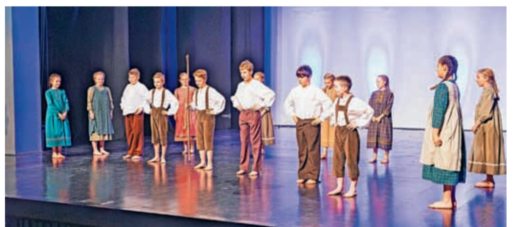
Folklorna skupina Thin na odru Doma kulture Kamnik