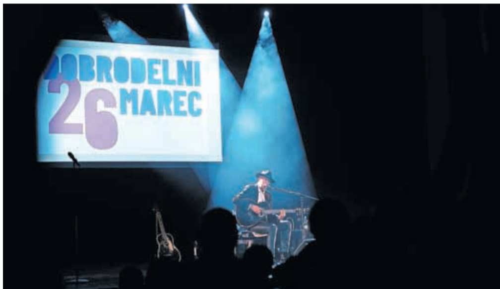
Vrhunec dobrodelnega marca je predstavljal koncert Vlada Kreslina.